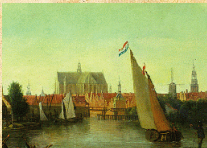
De Sint Laurenskerk in Alkmaar

Voordat de gotische bouwstijl op gang kwam, had je de romaanse bouwstijl. Deze stijl was vooral herkenbaar door het gebruik van rondbogen en zware muren met kleine vensters.