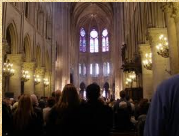
De gotische bouwstijl herken je aan de spitsbogen en hoge ramen.