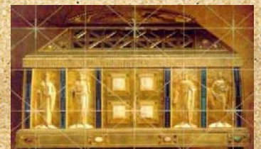
Hildegards Sarcofaag in Eibingen, Duitsland

... in het klooster, dat ze zelf stichtte, haar muzikale werken uitgevoerd werden?