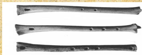
Fluiten werden in deze tijd nog vaak van botten gemaakt.

Je hebt nodig: een computer en koptelefoon