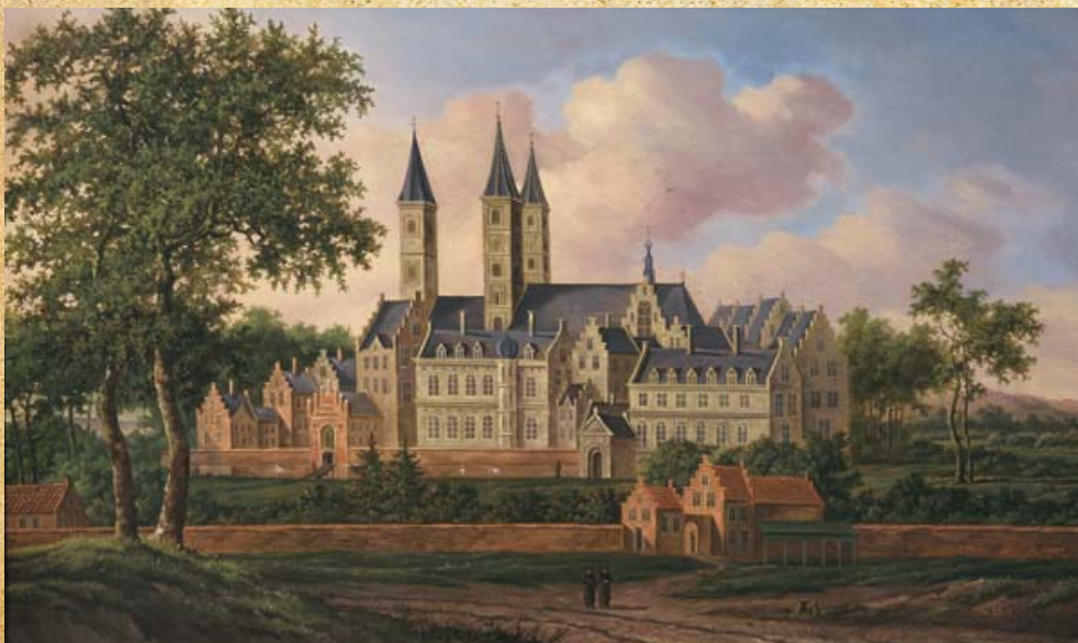
De Sint Adelbertabdij voor 1573 (schilderij uit 1681)

Stel je voor dat je in de tijd van steden en staten een klooster bezoekt. Welke geluiden zou je dan om je heen horen?